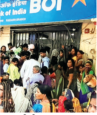
हरिभूमि न्यूज ▶▶ राजगढ़